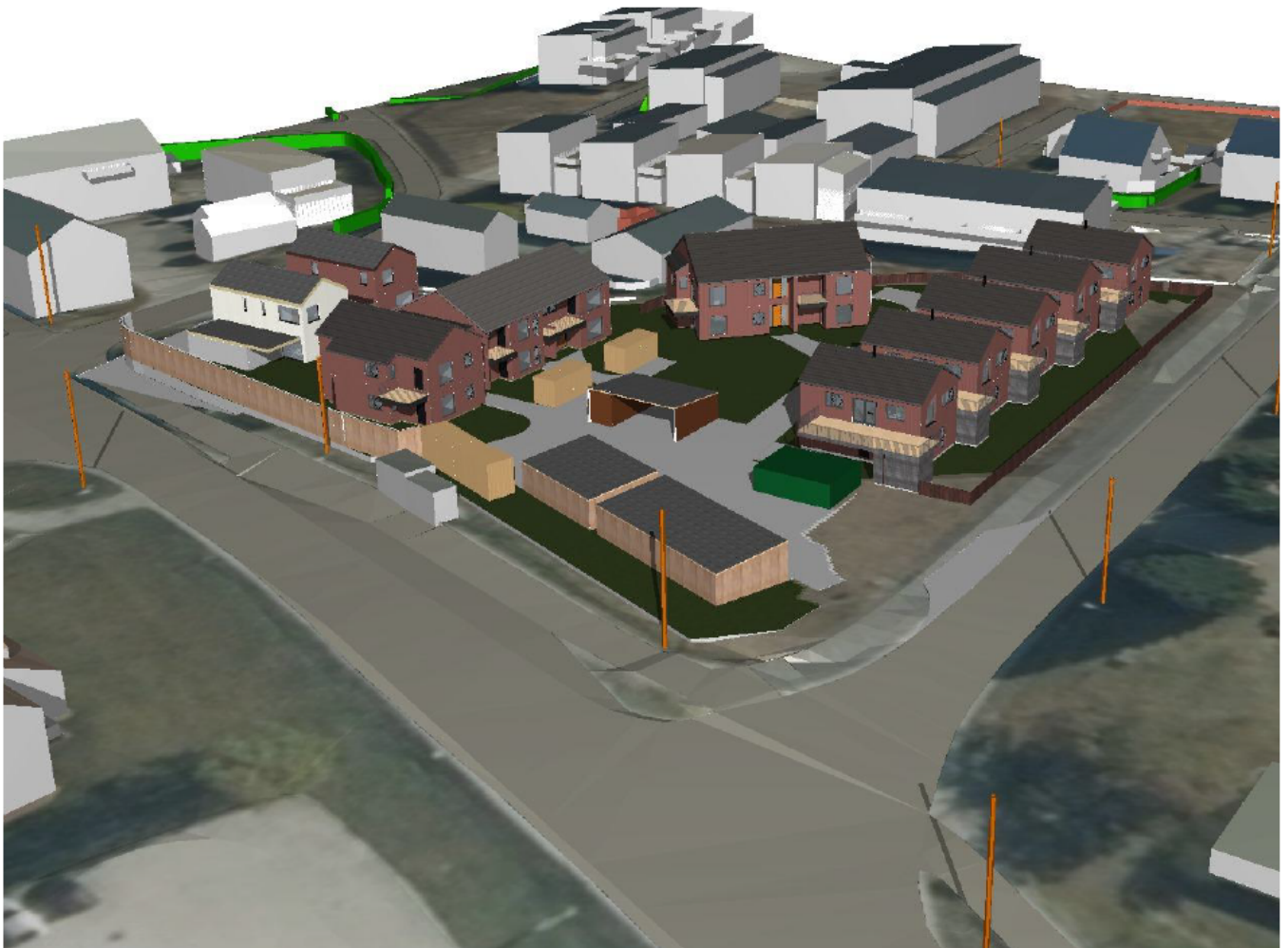
Figur 2: Skisseperspektiv fra sørvest

Planforslaget viser små endringer for sol og skyggeforhold til omkringliggende bygg. For en av naboene mot øst vil det bli noe reduserte solforhold på ettermiddagen, kl. 18. De vil også få mindre utsikt mot sør og vest. Det er gjort gode grep ved å legge opp til siktlinjer mot sørvest og vest mellom flermannsboligene. Grepene gjør at planlagt utbygging ikke føles for kompakt.