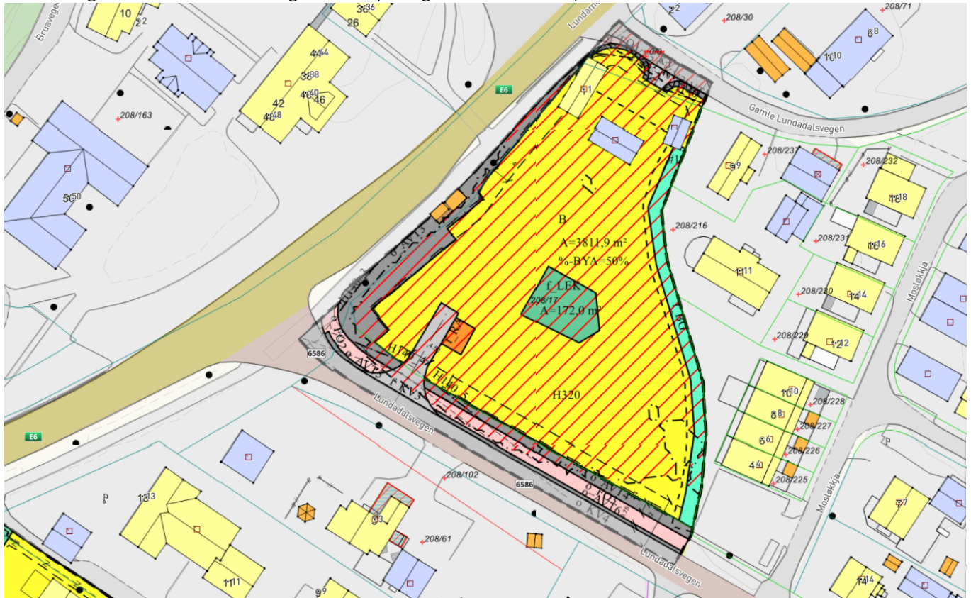
Figur 1: Utsnitt av plankart

Planforslaget er utarbeidet av Norgeshus AS på vegne av HAW entreprenør.